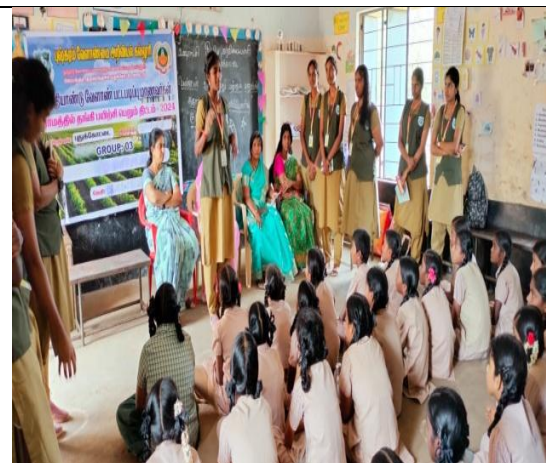
Group 6 students had creating awarness about organic farming at gov. school.