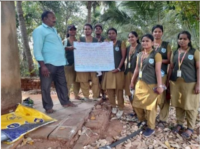
Our students discussed about the premium subsidy provided for kharif, rabi, annual Year commercial crops.