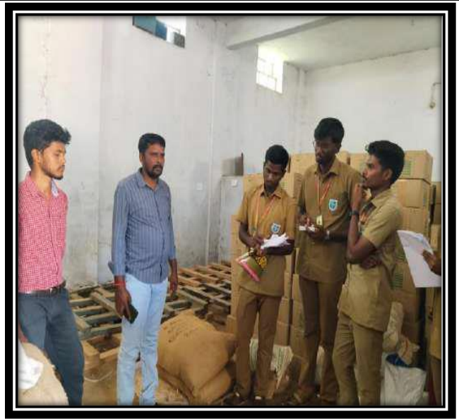
Learn about Agriculture input supply process