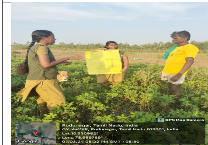
RAWE students had demonstrate about yellow sticky trap to farmers.