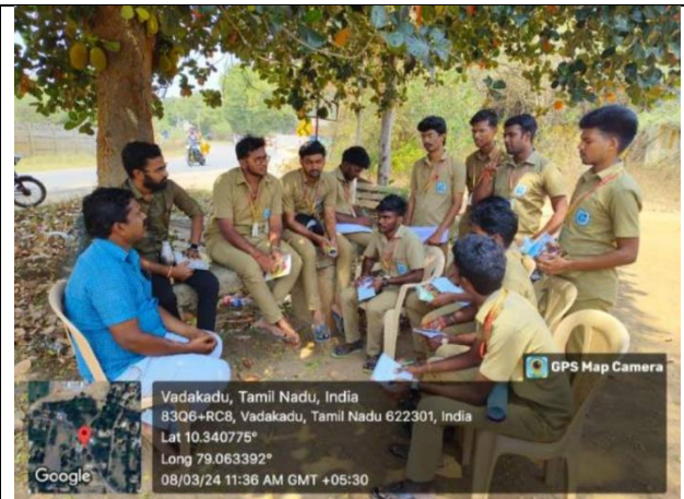
Our students demonstrated various strategies about Agri product marketing.