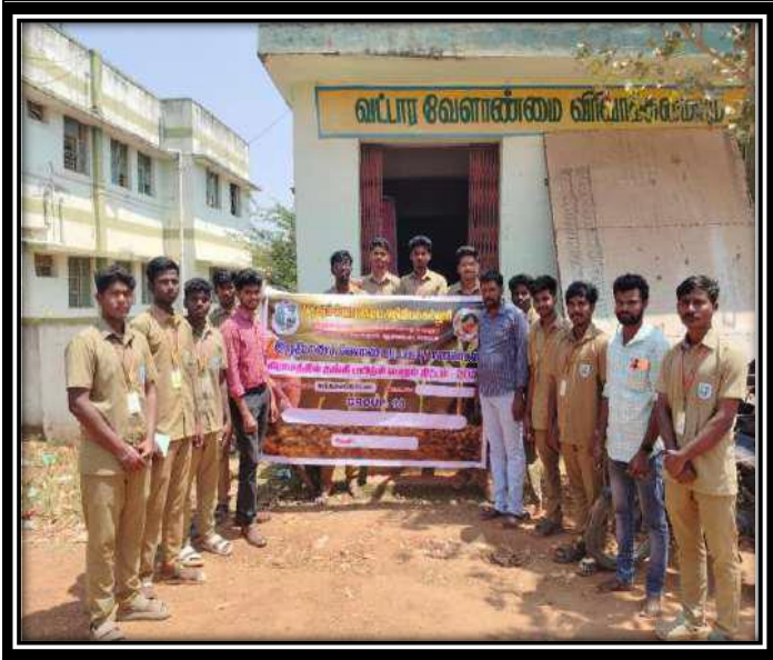
Group-10. Visit to ADA office Gandarvakottai block