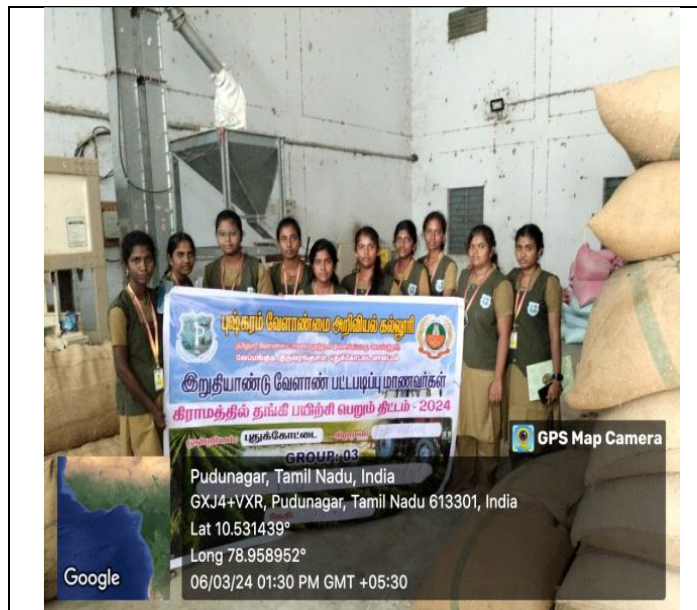
RAWE students have visit about modern rice mill.