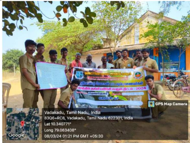
RAWE students demonstration about Uzhavan app to the local farmers of Vadakadu village