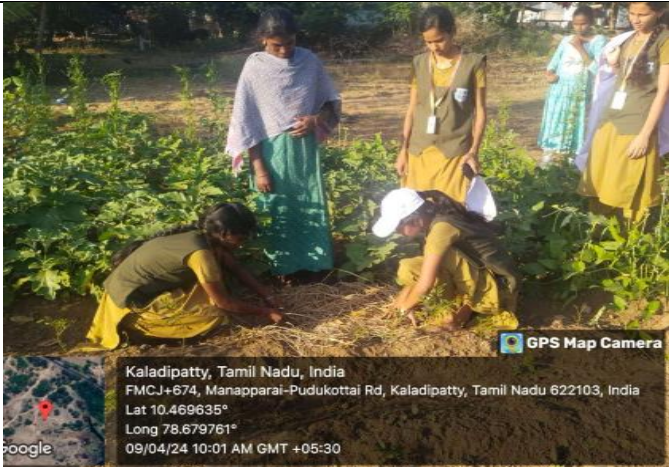
Our students DEMONSTRATION ON MULCHING to conserve soil moisture, prevent soil erosion