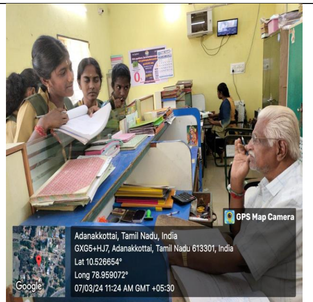
Visit to ADA Office