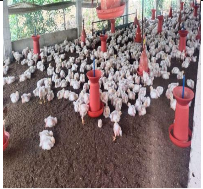
Our students VISIT TO POULTRY UNIT V.K.Raja poultry farm unit in Keelakurichi village