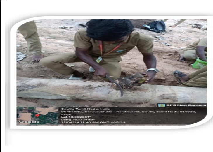
RAWE students demonstrated sucker treatment in banana